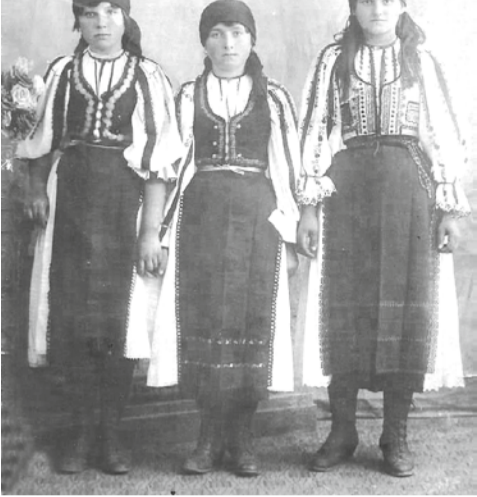
Costume ungurenești de acum 100 de ani

În sensul său concis, civilizația pastorală conține acele creații și valori cu care au lucrat și lucrează cei care au avut ca îndeletnicire creșterea oilor. Cercetările arheologice recente vorbesc despre descoperirea faptului că domesticirea oilor s-a produs în urmă cam cu 11.000 de ani și că pe teritoriul de azi al României sunt scoase la lumină numeroase resturi fosile foarte vechi de ovine. Aceasta a însemnat că oaia a fost un factor foarte important, dacă nu cel mai important, în supraviețuirea omului în decursul ultimelor 7-8 milenii. Prin caracteristicile lor, după cum se știe, ovinele au asigurat abundența de hrană pe care omul o poate conserva tot anul, mijloace eficiente de protejare împotriva frigului, a intemperiilor, contribuind astfel la buna funcționare a organismului uman. Adăugăm aici și aspectul economic al rodniceii muncii. Faptul că și azi doi ciobani pot păzi vreo 700 de oi și realizează în condiții normale de climă și liniște socială venituri de 7-8 ori mai mari decât în agricultură sau chiar în alte domenii, ne vorbește de la sine despre valoarea acestei îndeletniciri.