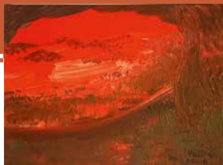
Crepusul spre Atlantic