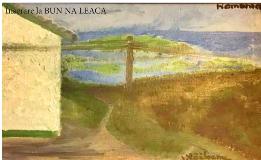
Înserare la BUN NA LEACA

Cele 5 tablouri sunt realizate de pictorul Ion Văileanu în toamna anului 2000, pe când se afla în vizită în Irlanda la fiica sa, COLUMBIA HILLEN. Picturile se