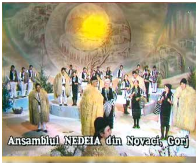
Ansamblul NEDEIA din Novaci, Gorj

Au trecut așadar 60 de ani de la inaugurarea celei mai importante instituții de cultură din Novaci și zonă,