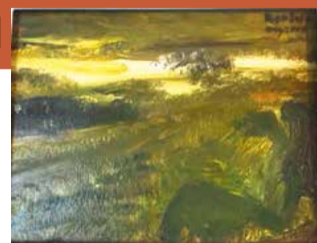
Popas în Donegal