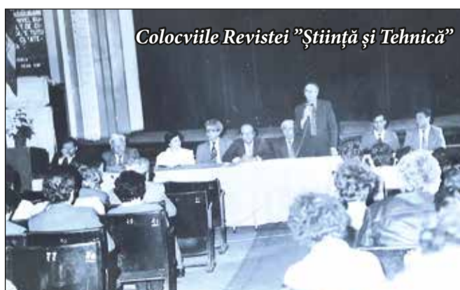
Colocviile Revistei „Știință și Tehnică”

Biblioteca orașenească și Asociația Culturală din Sas van Gent-Olanda, promovarea talentelor locale în domeniul