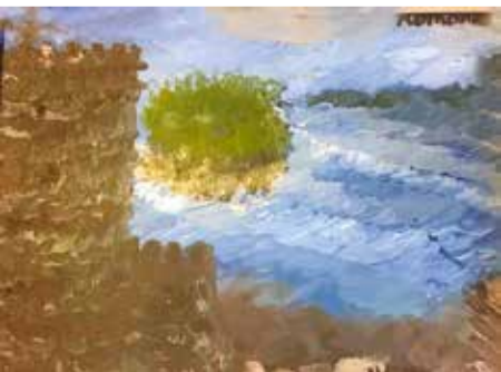
Imagini de pe Insula Terry