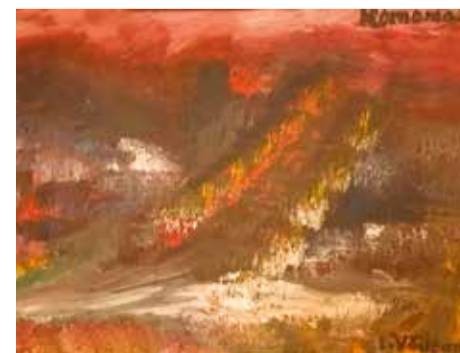
În drum spre BUMBEG