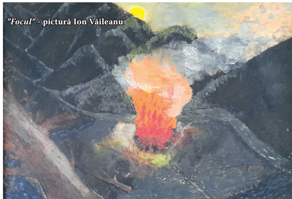
„Focul” - pictură Ion Văileanu

Spre seară a venit un plutonier, m-a descătușat și mi-a spus că deocamdată îmi dă drumul, până la terminarea anchetei. Am aflat mai târziu că ancheta s-a finalizat cu rezoluție „foc minor în pădurea din Măgură”. La Facultatea de Filosofie aveam să află ceea ce a spus Socrate - cum că a face unui om o nedreptate, este cel mai mare rău.