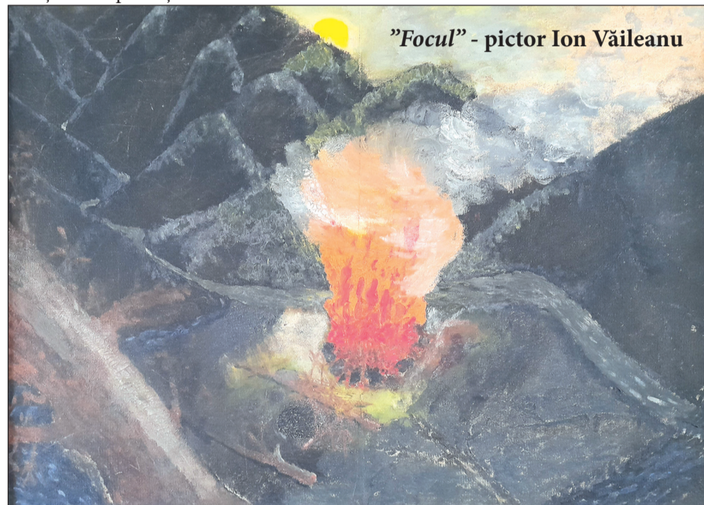
”Focul” - pictor Ion Văileanu

Concretul în reportaj are o mulțime de elemente pe care nu le conțin celelalte genuri jurnalistice. Noi ne străduim să comunicăm sensul și semnificația pentru oameni, o semnificație a fenomenelor sociale sau naturale. Numai așa putem să ne îndeplinim misiunea de reporter. Mai mult, presa are menirea pe care o va lua ca atitudine în raport cu fenomenele culturale. Aceasta înseamnă că atunci