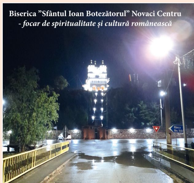
Biserica "Sfântul Ioan Botezătorul" Novaci Centru - focar de spiritualitate și cultură românească