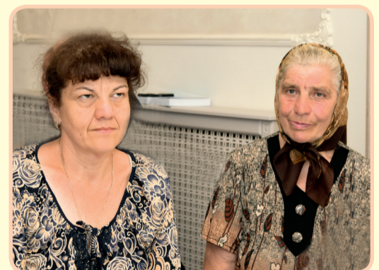
Soția și fiica poetului